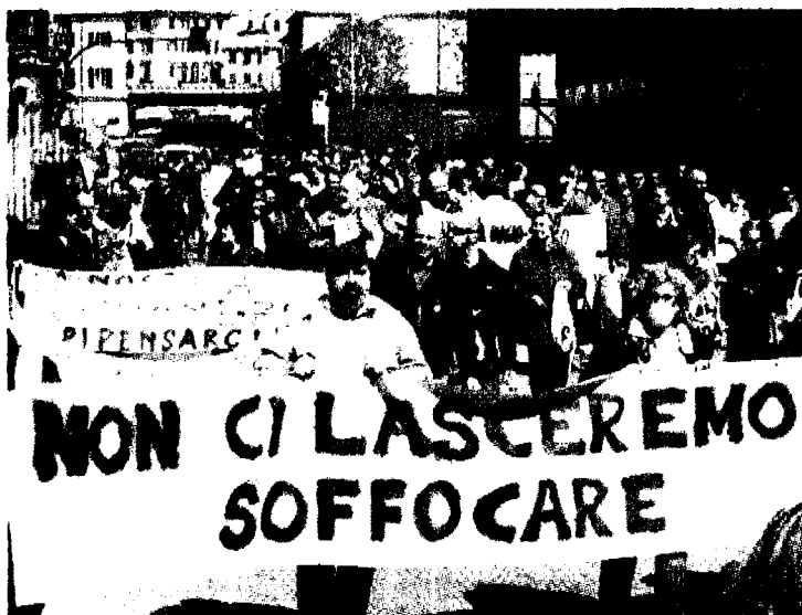
Il corteo dei comitati sfilava nelle strade di Sampierdarena