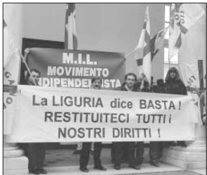
La protesta dei leghisti a Palazzo Ducale