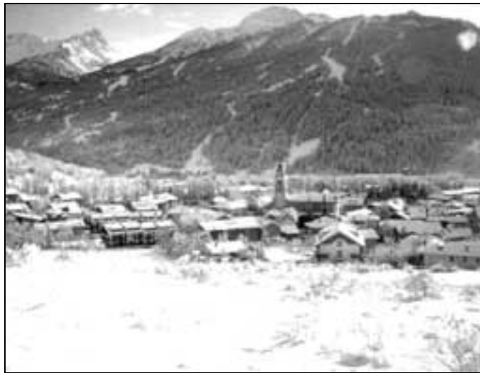
Una veduta di Bardonecchia dopo le nevicate dei giorni scorsi