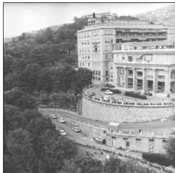
L'ospedale Maragliano dove è stata ricoverata la donna